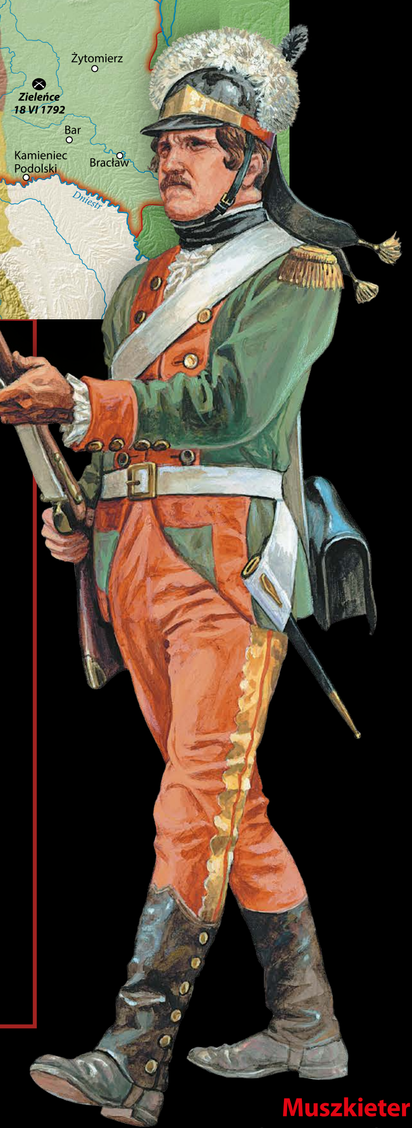
Muskieter piechoty rosyjskiej