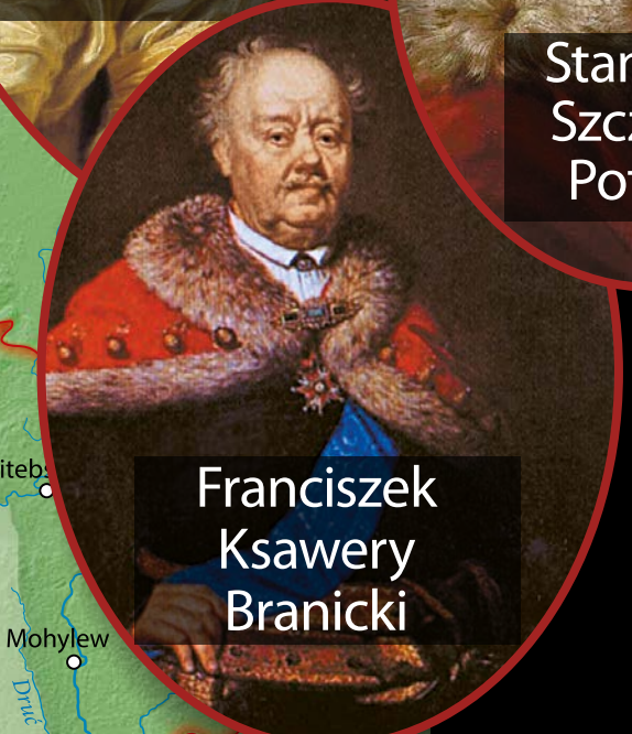
Franciszek Ksawery Branicki