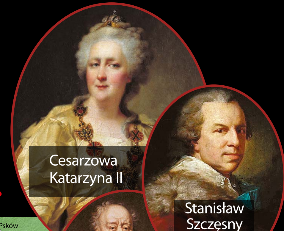
Cesarzowa Katarzyna II

Wiosną 1792 r. wrogowie konstytucji (Franciszek Ksawery Branicki, Stanisław Szczęsny Potocki) zwrócili się do cesarzowej Rosji Katarzyny II z prośbą o interwencję w Polsce. Akt konfederacji ogłoszono w Targowicy . Latem 1792 r. wojska rosyjskie wkroczyły na terytorium Rzeczypospolitej. Mimo bohaterskiej postawy armii polskiej w bitwach pod Zieleńcami i Dubienką król zdecydował się przerwać walkę i przystąpił do Targowicy.