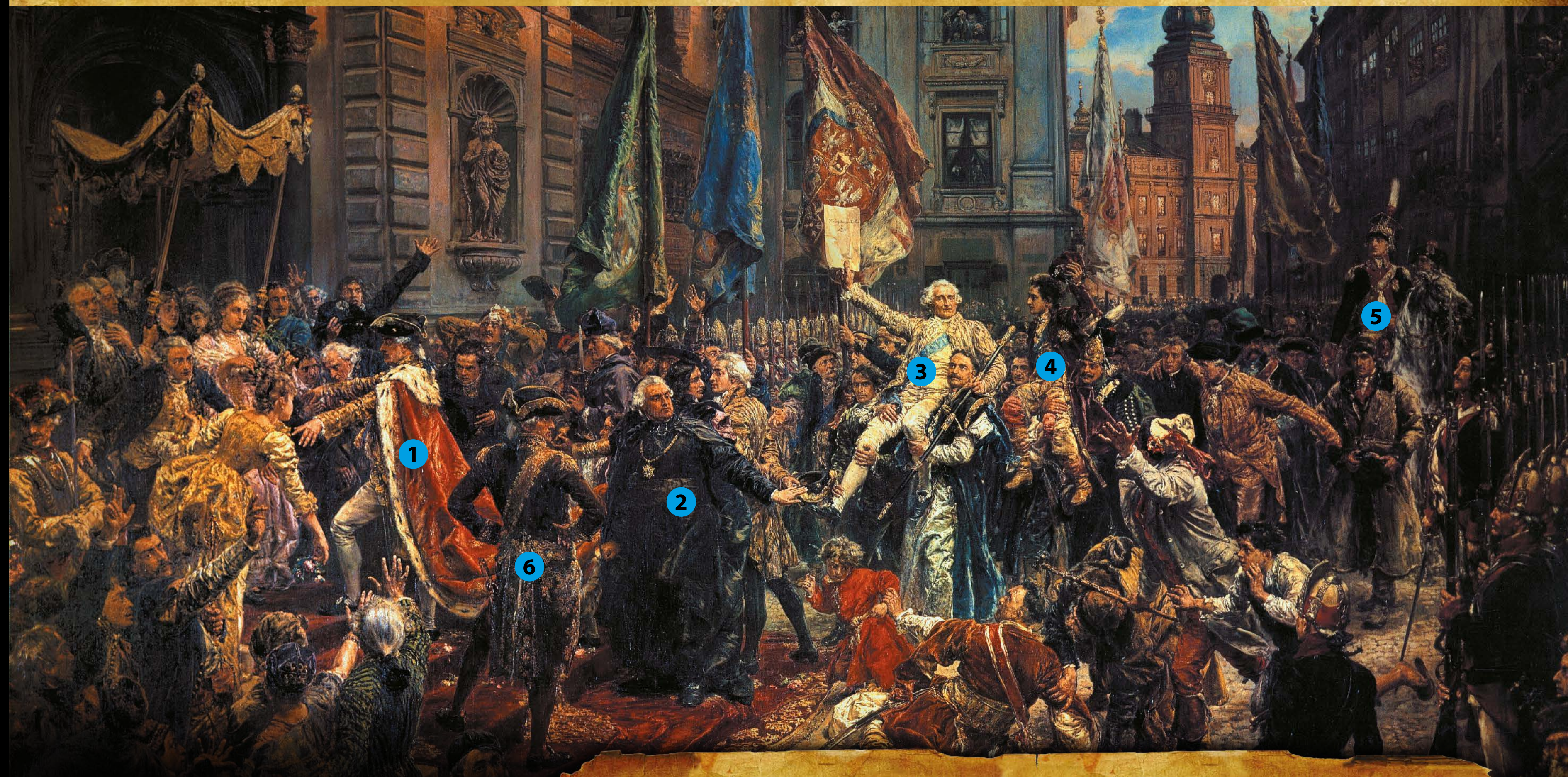
Jan Matejko, Konstytucja 3 maja 1791 roku , 1891

Obraz Jana Matejki ukazuje przemarsz posłów na nabożeństwo dziękczynne z zamku do katedry św. Jana.